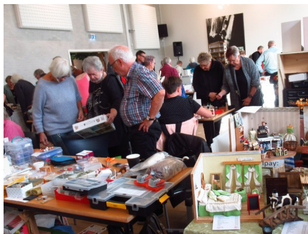
Der blev handlet flittigt ved alle staderne.