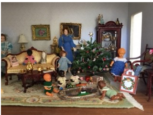
Dagligstuen, der er pyntet op til jul.