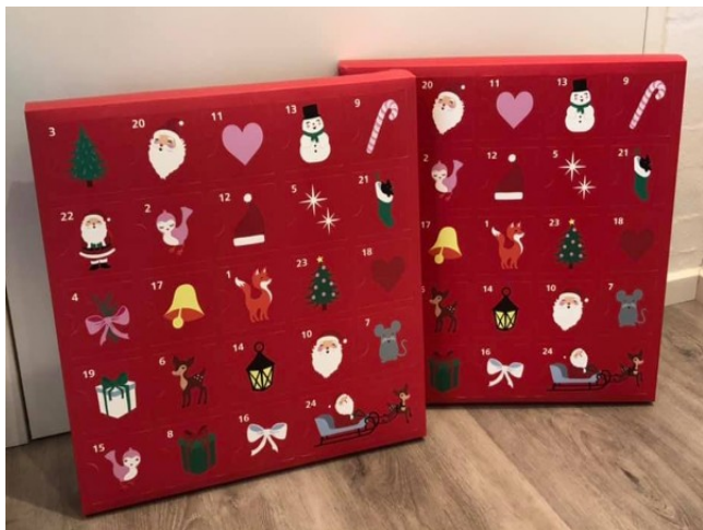
Elsebeth Buch Degns julekalender var mere traditionel.