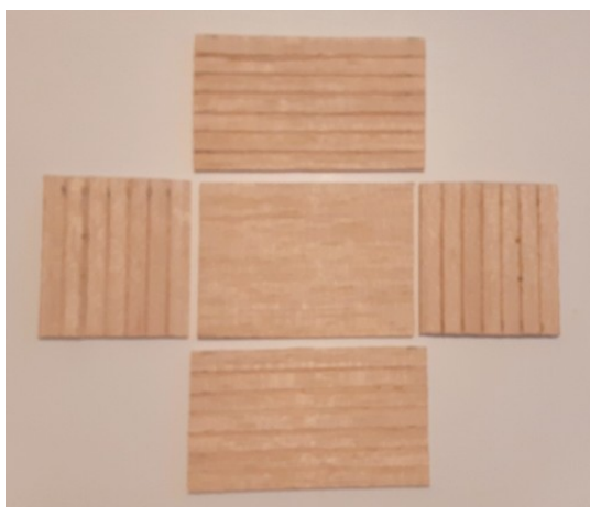
Bund, sider og ender.