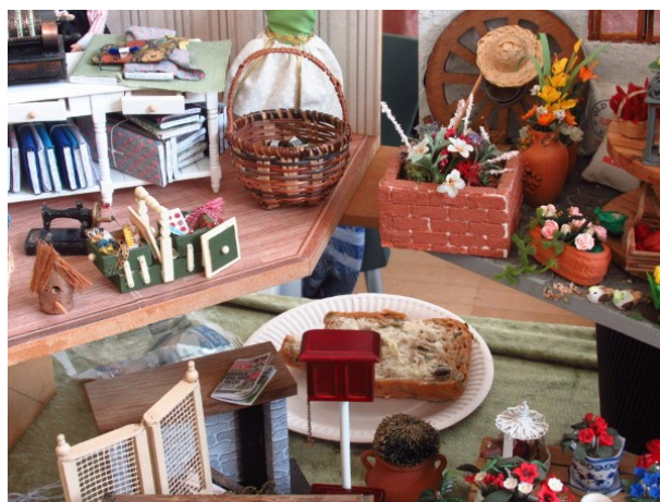
En lille bitte smagsprøve på alt det, der var til salg.