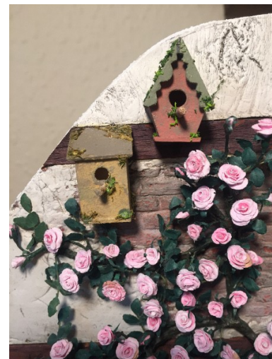
To modeller af fuglehuse.