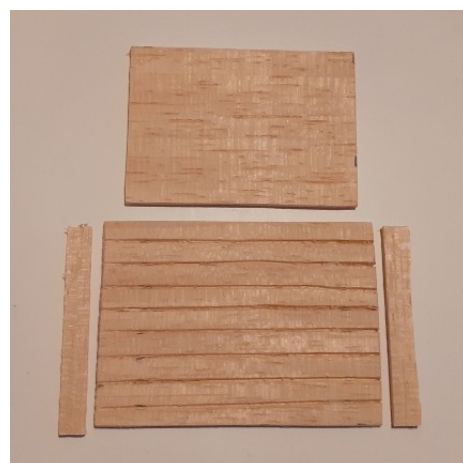
Låg, lågunderside og pyntelister.

På låget har jeg 1 cm fra enderne limet pyntelisterne fast.