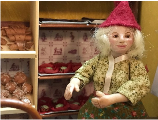
Den lyshårede nissepige er klar til at ekspedere kunderne.