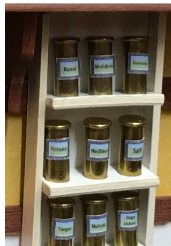
Krydderierne er lige ved hånden.