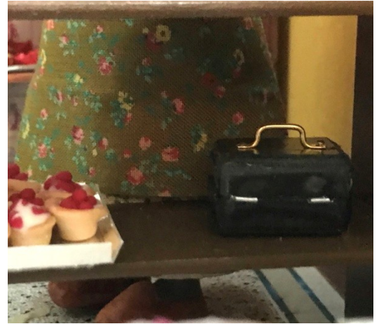
Pengekassen står på hylden under disken.