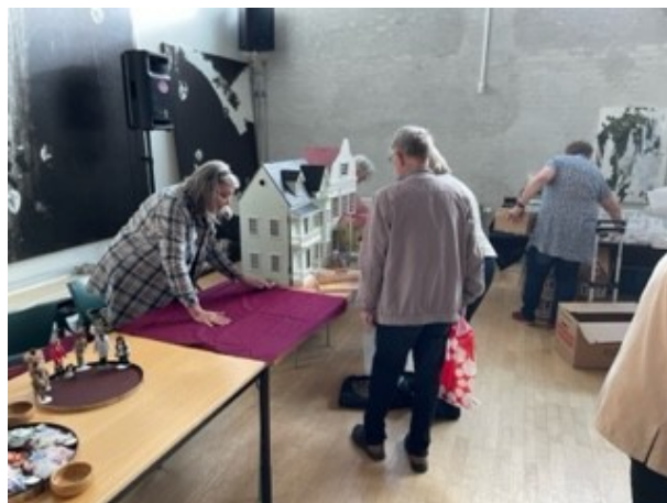
Der var 32 stadeholdere med mange forskellige ting til salg.