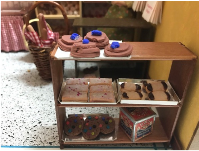
Reolen er fuld af lækre kager. Bagved er der en kurv med flûtes.