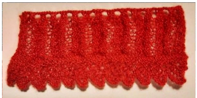
Nærbillede af gardinet.