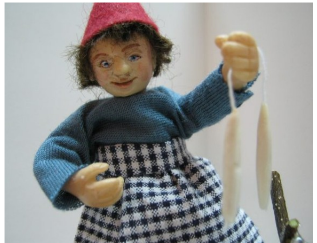
En af de mange festlige nisser, du kan finde på Pederstrupgård i Ballerup.

Har du ikke mulighed for at besøge museet, kan du se alle misserne her: Mini-nisserne på Ballerup Museum .