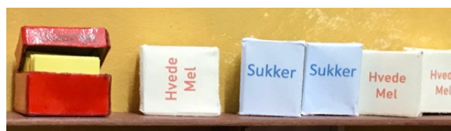
Alle bageopskrifterne er i den røde æske.