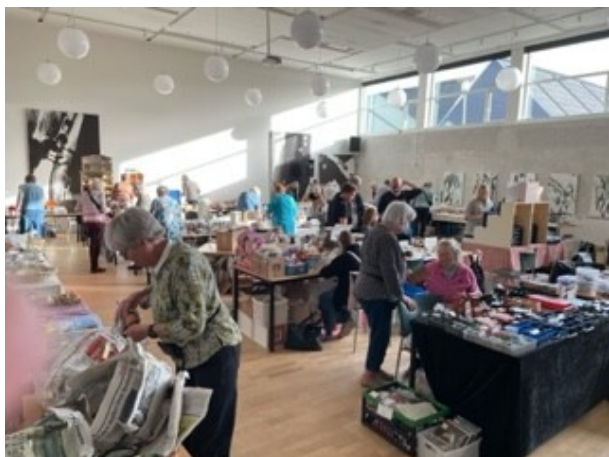
Stadeholderne havde travlt med at få det hele på plads.

Jeg tror, de fleste stadeholdere giver mig ret, når jeg siger, at det igen var en succesfuld dag i Farum.