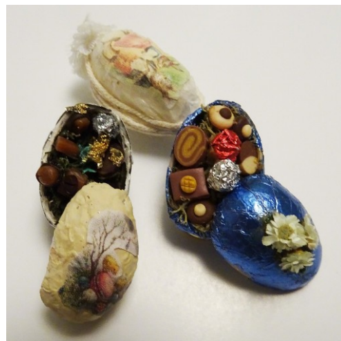
Påskeæg - papæg med chokolade.