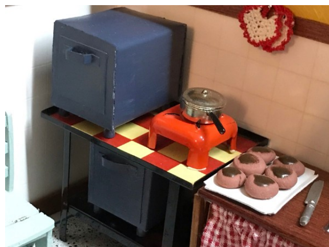
Der er to ovne i bageriet.