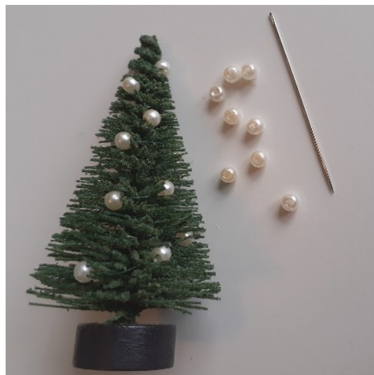
Juletræ med pynt.

I tiden op til jul kan man bl.a. købe mini juletræer hos Søstrene Grene, Planteskoler, Super- og Byggemarkeder. Dem kan man nemt dekorere, så de passer til en hyggelig jul i dukkehuset. Her har jeg i toppen af træet bundet grøn sytråd fast, hvorpå jeg har sat perler på tråden og snoet den rundt om træet således at perlerne "hænger" som julekugler på træet. Man kan evt. tage foden af træet og placere det i ler i en potte. Nogle af disse træer har det med at drysse grønt fnul-ler, men hvis man giver træet en gang hårlak inden man dekorerer det, så drysset det ikke.