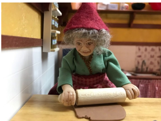
Nisse mor ruller dejen ud.