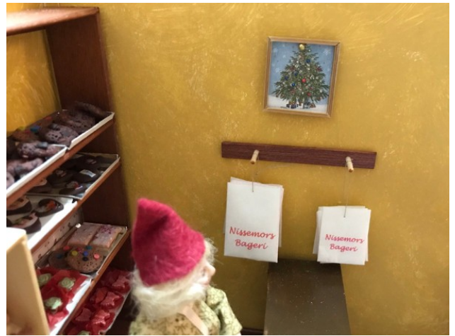
Poserne hænger klar til at putte kager i.