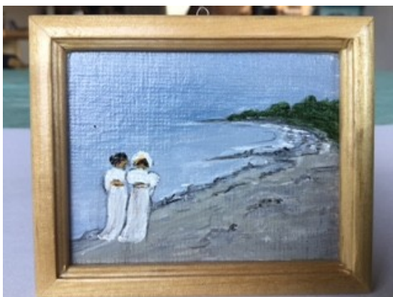
"Damerne på stranden" af Krøyer malet som miniaturebillede af Ruth Foli.

I dukkehuset har jeg to miniaturemalerier malet af Ruth Foli: "Damerne på stranden" af Krøyer og "Sommerspiret" på Møns klint.