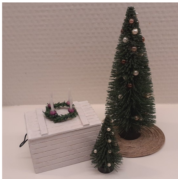
Den færdige kasse.

Først har jeg limet enderne på bunden med de "ridsede" sider ud af. Dernæst er siderne limet på. På undersiden af låget er pladen limet på, så der er 2 mm ud til kanterne hele vejen rundt, dette gør at når man lægger låget på kassen, så glider det ikke, men lukker kassen.