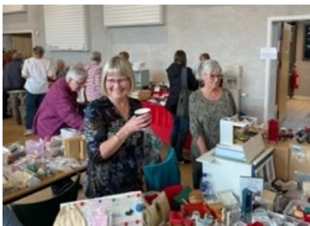
Der var tid til en lille kop kaffe i travlheden.