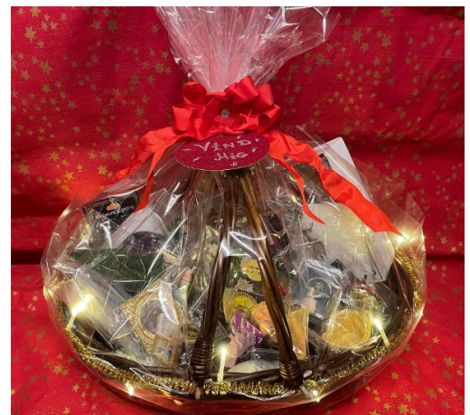
Den store gavekurv doneret af Dukkehus Kram Biksen & Dukkehuset Hobbykarla,