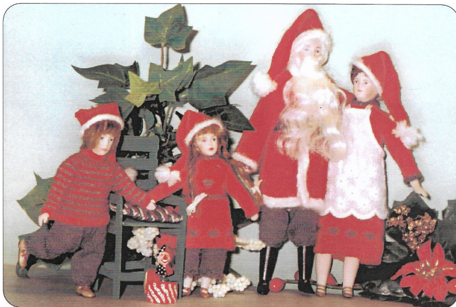
Hele familien i det fineste nissetøj.