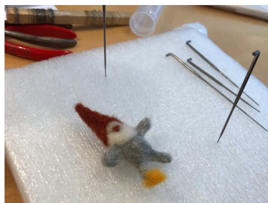
En lille filtnisse bliver til - et eksempel på alle de mange forskellige projekter deltagerne arbejder med på Lang Lørdag.

Værkstedet i Farum: 2022: 08.01.+ 22.01 + 05.02.+ 19.02 + 05.03.+ 19.03 + 02.04. + 30.04 + 14.05. + 28.05. + 11.06. 25.06.