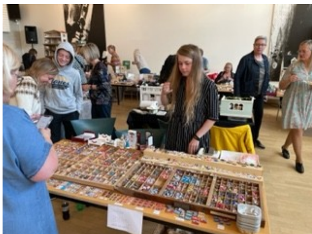
Udbuddet af forskellige ting var meget stort.