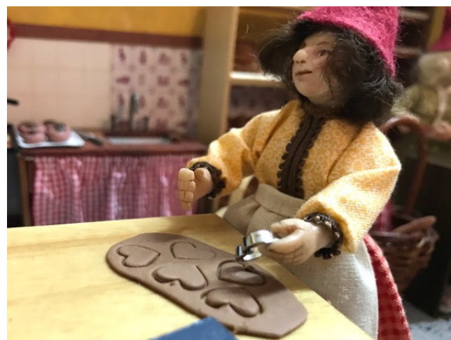
Den mørkhårede nisse pige stikker honninghjerterne ud.